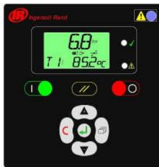
Interfaz del controlador de la Serie L

La operación de los controles es simple y muy intuitiva.